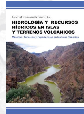
Hidrología y recursos hídricos en islas y terrenos volcánicos Santamarta JC et al.

Se facilita toda la documentación del curso y los libros en formato digital siguientes: