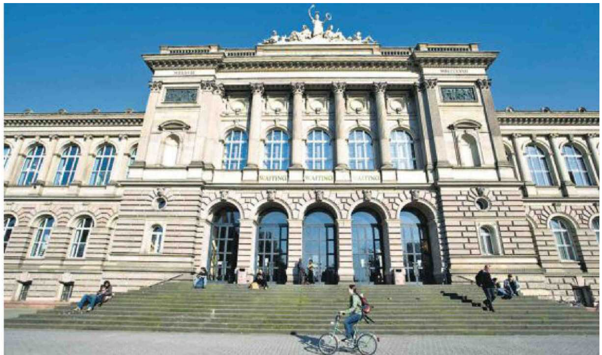
En la nueva Universidad de Estrasburgo (Francia) se han fusionado tres universidades, varias grandes écoles y un hospital.