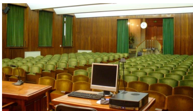
Aula Magna de la Facultad de Farmacia - UB

El último día se hará la clausura del congreso en el Aula Magna de la Facultad de Farmacia de la UB. Esta aula se encuentra enfrente del edificio de la residencia donde nos alojaremos.