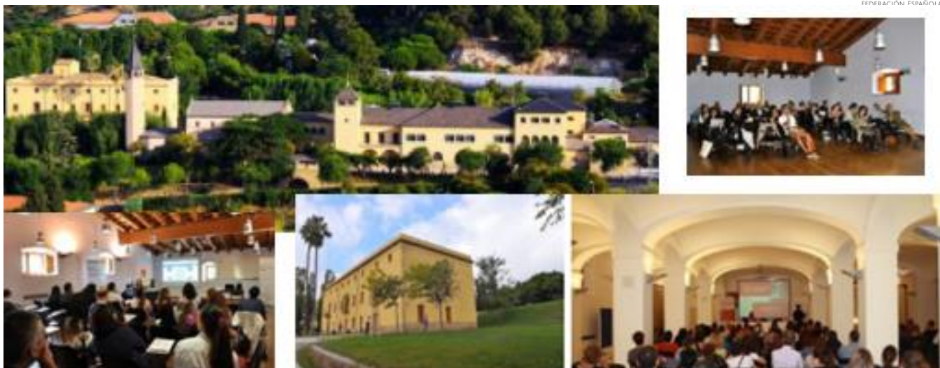
Campus de la Alimentación – UB, Santa Coloma de Gramenet.

Es un punto a favor el hacer el primer día allí en Torribera ya que en este campus se disponen de Aulas-Cocina dónde hacer el Taller de cocina propuesto. El traslado desde Torribera hasta la residencia se hará en bus (incluido en el precio de la inscripción).