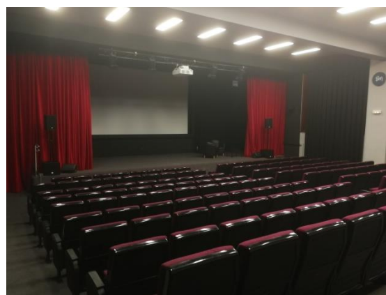
Espacios de la Residencia Penyafort