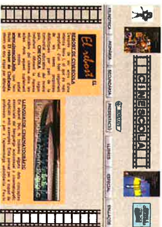
Cuadro 1. Captura del portal de CinEscola

El proyecto de consolidación de CinEscola ha pasado por diferentes fases hasta que, finalmente, la buena acogida por parte del profesorado de las propuestas didácticas colgadas en sus inicios, configuró los diferentes materiales complementarios que conviven en el portal educativo.