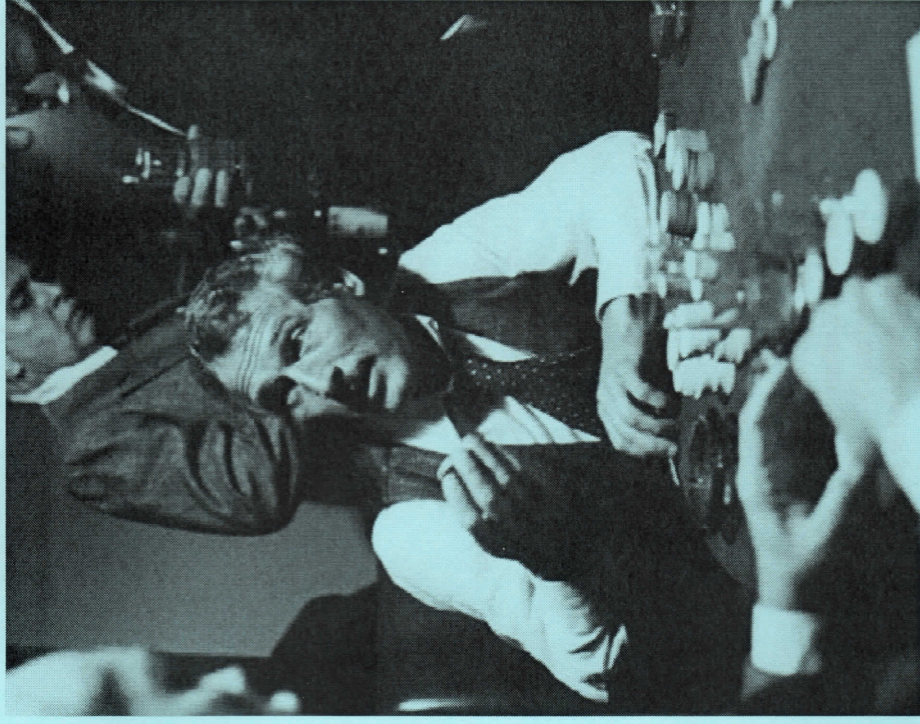
Paul Newman, amb Robert Redford, va ser el gran protagonista d' El golpe