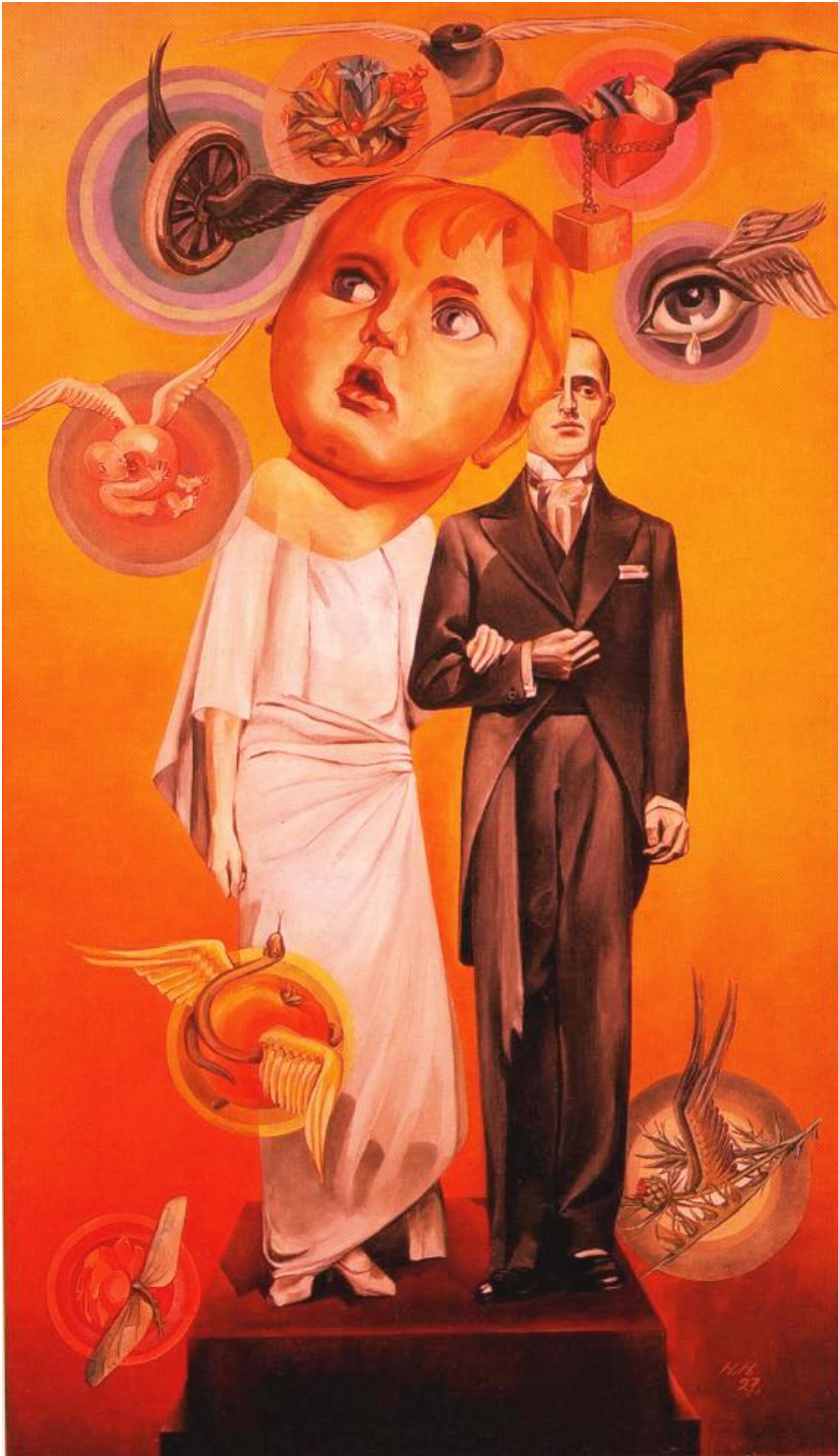
O esta otra obra, titulada : Pretty maiden!