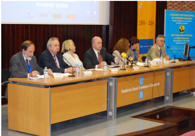
Ponents de la X Reunió Internacional d'Economia Mundial (REM)

Els darrers dies 29 i 30 de maig, la Facultat va acollir la X Reunió Internacional d'Economia Mundial (REM) que cada any organitza la Societat d'Economia Mundial (SEM).