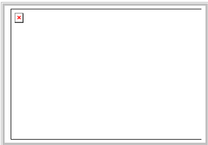
Sala de Juntes. Recompte de vots

Ja s'han publicat els resultats de l'escrutini de les eleccions d'estudiants (provisionals), del personal acadèmic, i del personal d'administració i serveis a Junta de Facultat.