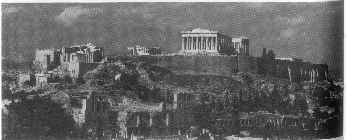
ὁ Ζηνόθεμις ὄρᾳ τήν τε ἀκρόπολιν καὶ τὸν Παρθενῶνα