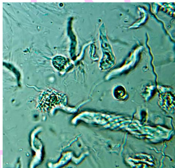
Tall transversal d'un tapís microbià (La Camarga). Microbiota intestinal de tèrmits