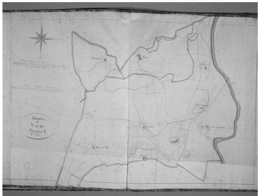
Figura 2: Full núm 1, «Sección A» de l'Atlas geomètric del término jurisdiccional de Vich, aixecat l'any 1852 pel geòmetra francès Jean-Antoine Laur.

Els primers documents cartogràfics d'aquest tipus de la província de Barcelona que s'han conservat són una mica més tardans i daten de 1851 (quadre 1). Es tracta de tres atles corresponents als municipis de Capellades, Mataró i Vilafranca del Penedès. Tots tres són relligats, tot i que l'exemplar de Vilafranca del Penedès que s'ha conservat és una còpia de l'original feta a començaments del segle XX. L'atles de Capellades duu la data més genè-