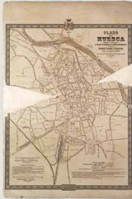
Piedra litográfica. Huesca. Archivo Municipal. imagen invertida.