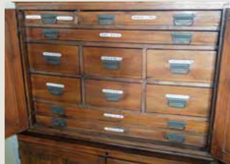
Armario en el que se contienen los planos de D. Casañal, Urbanismo, Ayuntamiento de Huesca.