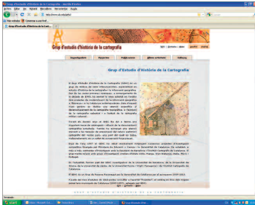
Figura 1. Pàgina web del Grup d'Estudis d'Història de la Cartografia. En l'apartat Publicacions i sota l'epígraf "Catàlegs en línia" es pot accedir al Catàleg de la cartografia parcel·laria municipal de Catalunya (1847-1897) aplegada pel GEHC. http://www.ub.edu/gehc/index.html

zel dels mateixos funcionaris municipals, que han vetllat per a la seva conservació. La permanència d'ús d'aquests documents durant tants anys ha fet que actualment gairebé cadascun tingui una història de supervivència al darrere. Alguns ni això. Una part dels mapes ja no s'han pogut localitzar, malgrat trobar-ne tota la documentació relativa a la seva realització. D'altres, per sort pocs, han acabat passant a mans privades, cosa que encara en dificulta més la localització. No cal dir que la recerca no és tancada i encara, de tant en tant, apareixen exemplars nous. 3