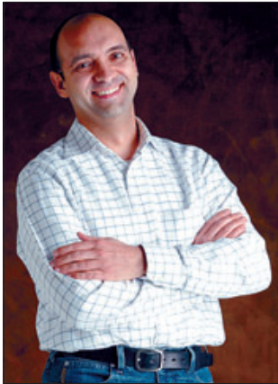
Pere «La meua filla és inquieta, molt independent, ho pregunta tot i no és gens vergonyosa».