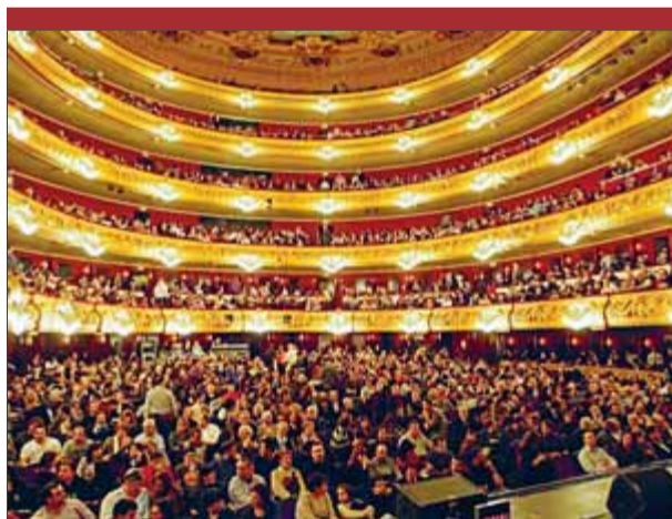
Verdi obre la temporada 2013-2014