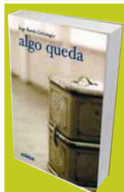
Algo queda Inge Barth-Grözinger Traducció: S. Hernán-Gómez Edebé Barcelona, 2007 Preu: 18 euros Pàgines: 328

s'hi respira, el que el lector sap que passarà després, la descripció de l'indret, la vida i els costums de l'època, la rigidesa jueva i la descoberta per part dels adolescents d'un futur estroncat per la intolerància dels nazis locals. Publicada en traducció castellana, un la voldria veure també en català, àmbit dins el qual, sens dubte, tindria un lloc d'honor entre les novel·les que els últims anys han destapat l'horror del nazisme.*