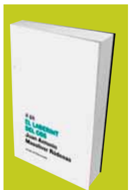
El laberint del cos Juan Antonio Masoliver Ródenas Cafè Central / Eumo Vic, 2008 Preu: 15 euros Pàgines: 46