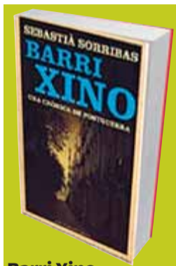
Barri Xino Una crònica de postguerra

Mosaic d'un espai molt concret Sorribas -nascut al Barri Xino l'any 1928- ens ofereix un ampli i variat mosaic centrat en un espai molt concret -el quadrat que formen el carrer Nou, la Rambla, el Portal de Santa Madrona i el Paral·lel- i en