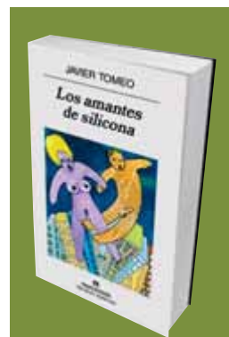
Los amantes de silicona

Javier Tomeo Anagrama Barcelona, 2008 Preu: 15 euros Pàgines: 143