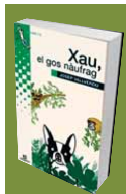
Xau, el gos naufrag

la novel·la real, apareix el mas Tolosa, on va néixer i viure Rovelló -ara una casa rural- i s'hi recorda qui era Rovelló gràcies a la lectura i les adaptacions audiovisuals de la novel·la. ¿Rovelló va deixar herència? En qüestió de nissaga de gossos, no se sap mai fins on pot arribar la llavor.*