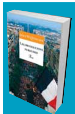
Les revolucions perdudes

Com diu el títol del primer capítol, en acabar de llegir aquest llibre hom té la impressió que El pensament científic és una experiència extracorpòria . Si passejar és “anar d'un costat a l'altre per fer exercici, prendre l'aire” ( DIEC2 ), aquesta és exactament la proposta d'Angier, una passejada pel món de la ciència per passar-nos ho bé, fer un bon exercici mental i oxigenar les nostres neurones i el nostre esperit crític.*