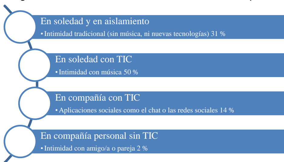
Figura 2. Distribución de las formas de vivir la intimidad en los jóvenes

Pese a que los chicos eran los que dominaban el universo tecnológico hasta fechas recientes; las chicas son las que presentan una mayor presencia del modelo de reflexión tecnológica, bien solas con música, bien con la compañía virtual o directa de sus personas más cercanas (mejor amigo/a y pareja). Esta tendencia se observa, sobre todo, en las generaciones más jóvenes.