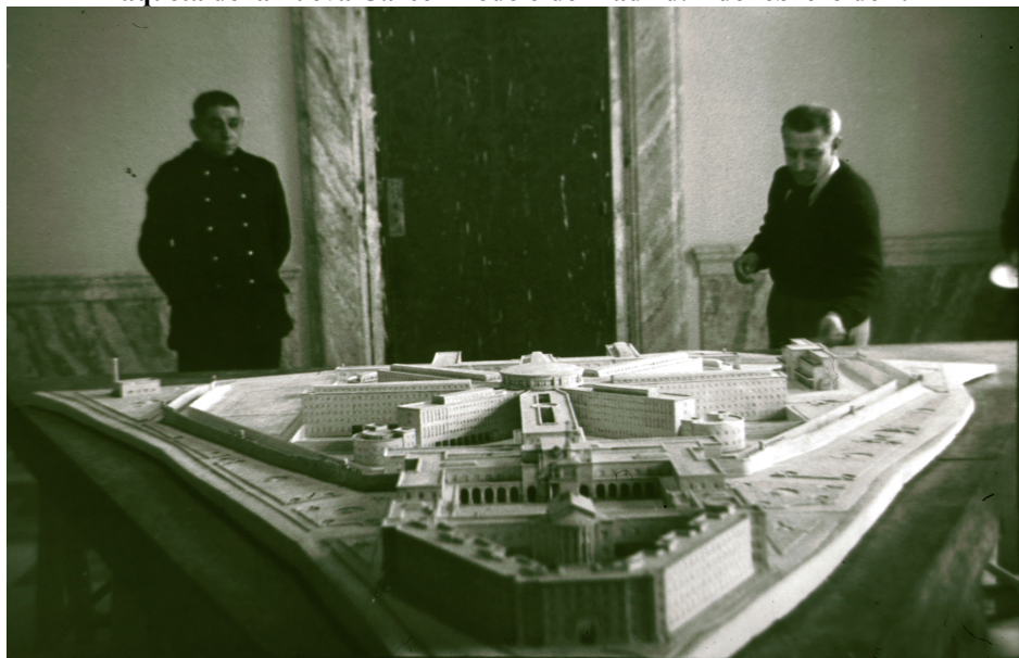
Figura 1 Maqueta de la nueva Cárcel Modelo de Madrid. 1 de febrero de 1941