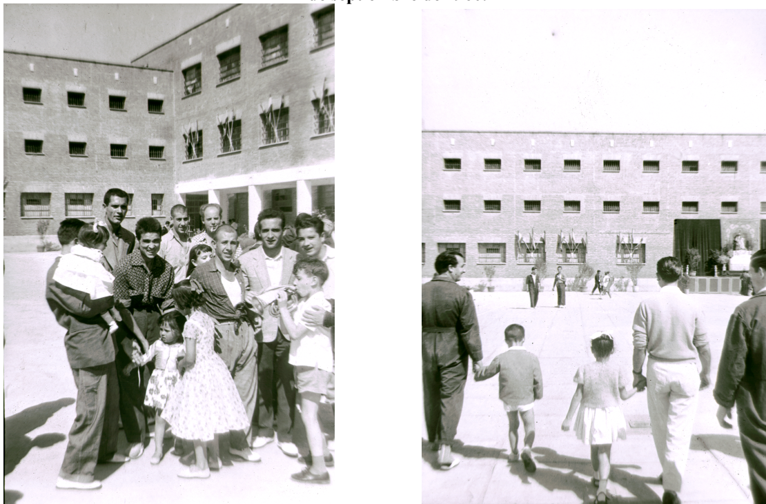
Figura 10. Reclusos de la Prisión Provincial de Madrid con sus hijos el día de la Merced. 24 de septiembre de 1960.

Archivo Regional de Madrid. Fondo Santos Yubero. 18063-1 y 18063-6.