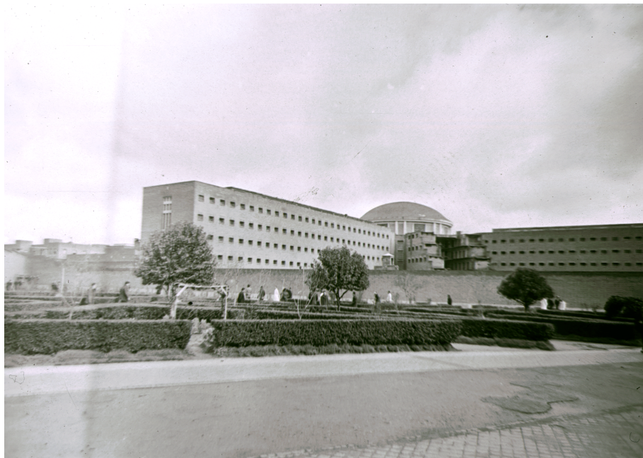
Figura 2 Edificio central del Complejo Penitenciario de Carabanchel, con una de sus galerías inconclusas 9 de marzo de 1962