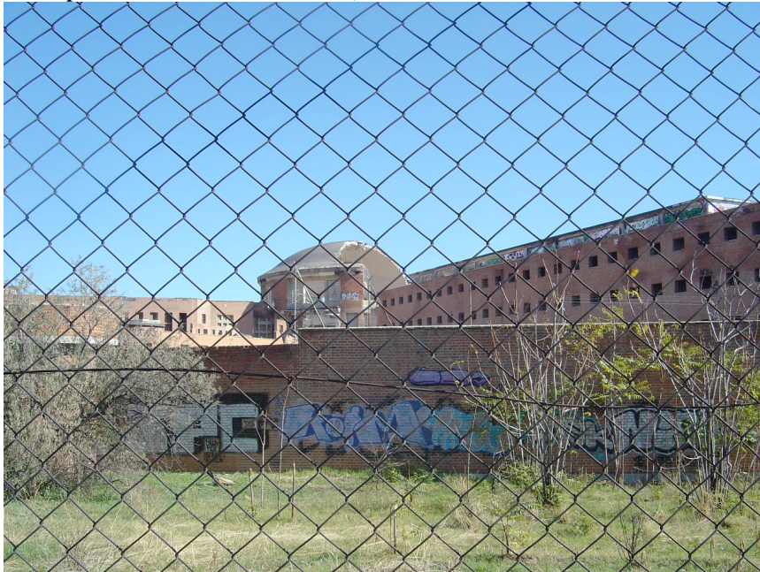
Figura 7 Cúpula central de Carabanchel, semiderruida. 26 de octubre de 2008.