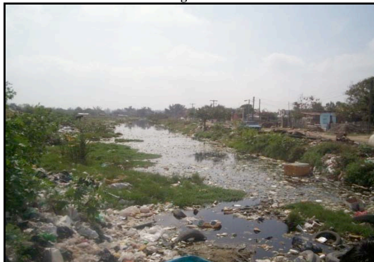
Imagen 7. Colonia Integración familiar