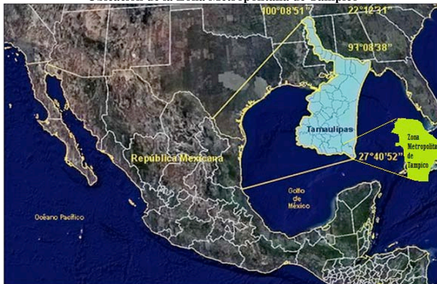
Figura 2. Ubicación de la Zona Metropolitana de Tampico