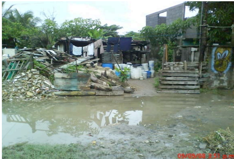
Imagen 6. Colonia Candelario Garza