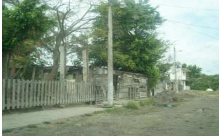
Figura 5. Colonia Pescadores