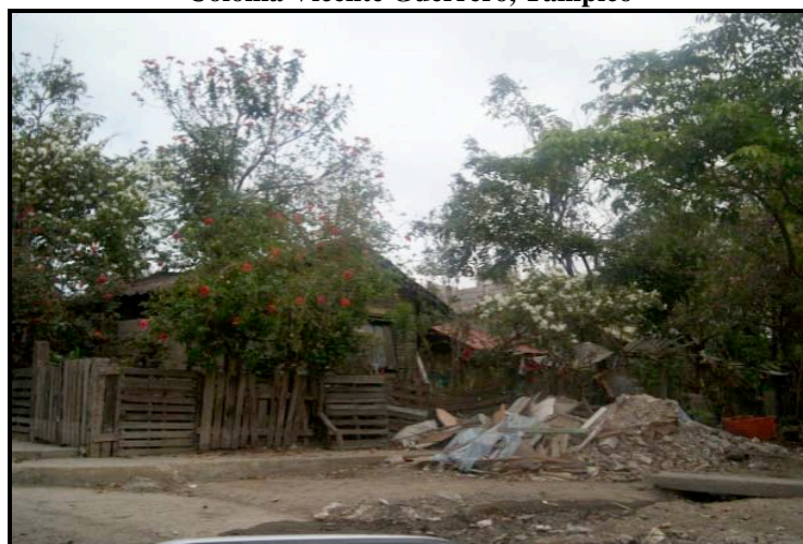
Figura 4. Colonia Vicente Guerrero, Tampico

Algunas imágenes que nos transmiten la realidad en estos asentamientos se muestran a continuación.