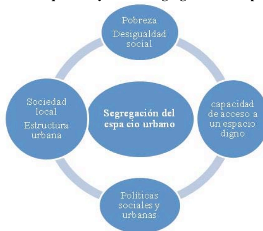
Figura 1. Factores que influyen en la segregación del espacio urbano

Desde los orígenes de la ciudad, la diferenciación socio-espacial ha sido una de las características de la estructura urbana. En América Latina se dan estructuras de segregación socio-espacial; entendiéndose el término de segregación como el proceso de la concentración selectiva de grupos sociales o demográficos en partes de la ciudad. Dicha segregación puede ocurrir como proceso voluntario o forzado e influyen diversos factores para que ésta se dé. Véase figura 1.