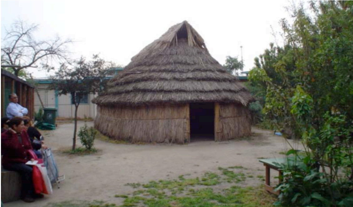
Figura 1. Ruka Kallfullikan, situada en Centro de Salud Los Castaños

La figura 1 contiene imágenes de estas dos rukas, en ellas es posible observar cómo se han construido importantes centros que además están acompañados de herbolarios, en los cuales se atiende tanto población mapuche como no indígena según la medicina tradicional indígena.