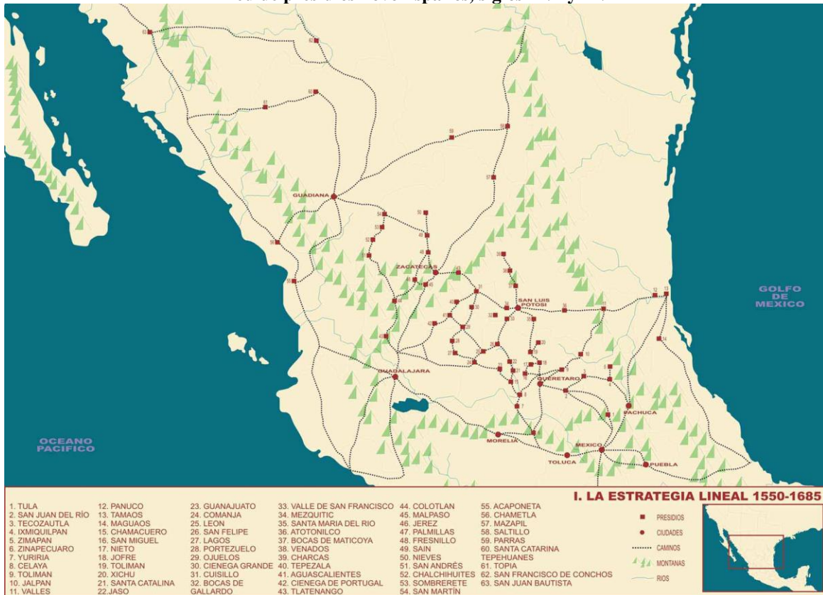
Figura 1. Red de presidios novohispanos, siglos XVI y XVII