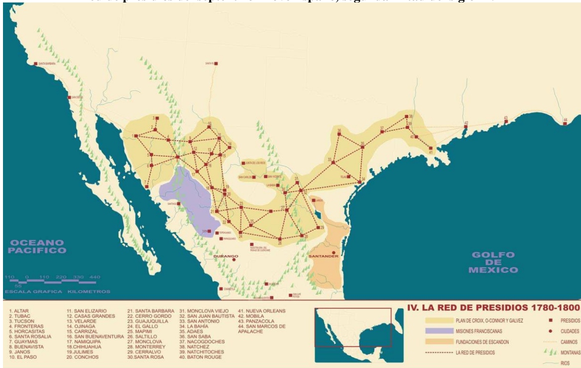
Figura 2. Red de presidios del septentrion novohispano, segunda mitad del siglo XVIII