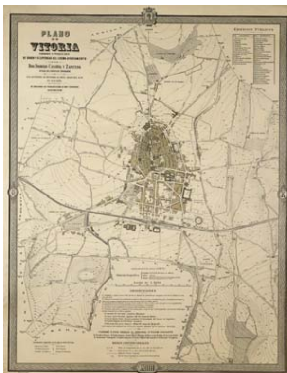
Figura 3. Plano de Vitoria (1888), a escala 1/5.000.

En la parte inferior, en la esquina izquierda, se relatan los instrumentos empleados en las operaciones de campo, muchos de ellos utilizados por el Instituto Geográfico y Estadístico para el establecimiento de la red geodésica nacional de segundo y tercer orden, y, en el centro aparece la escala gráfica y numérica, la equidistancia, los signos convencionales y los nombres de los colaboradores en el trabajo y de los miembros de la comisión facultativa. En la parte superior, en el marco, el escudo de Vitoria sustituye a la rotulación del norte y en la parte inferior el año de edición hace lo propio con el sur.