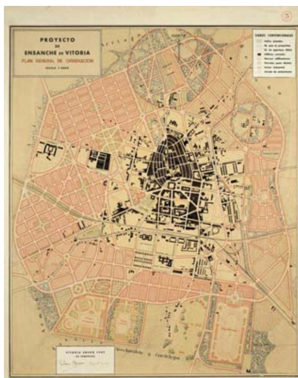
Figura 4. Proyecto de Ensanche de Vitoria. Plan General de Ordenación (1947).

la gran utilidad de los trabajos en el futuro de la ciudad, y el tiempo vendría a confirmar la premonición de Casañal.