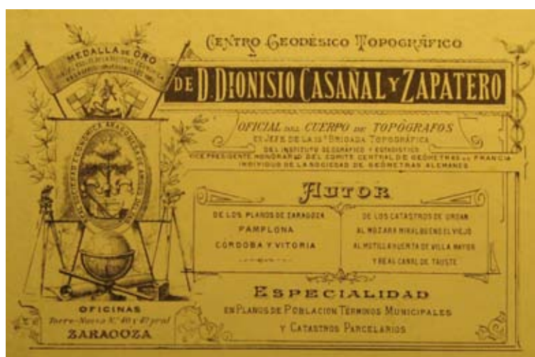
Figura 2. Etiqueta del Centro Geodésico-Topográfico.