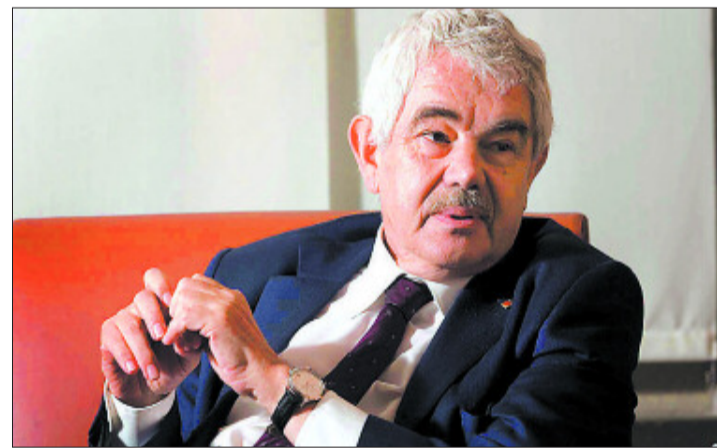
Pasqual Maragall, presidente de la Generalitat.

En este sentido, está claro que el proyecto de Maragall y el de Montilla es el mismo. Por ello digo sí a Montilla. Pero en ambos casos existe, además, un problema añadido. Este proble-