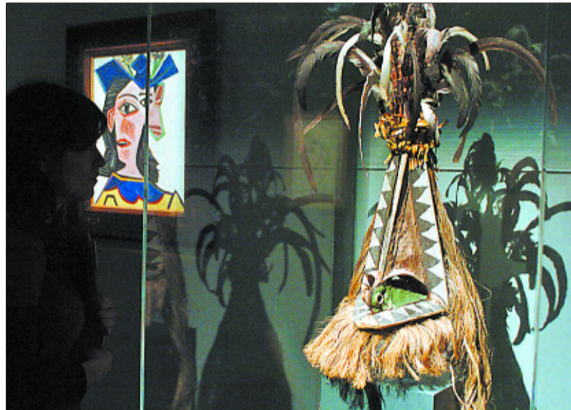
Escultura de Picasso expuesta en el Museo Barbier-Mueller.

La influencia del arte ibero, también evidente en Picasso, se pone de manifiesto en la Cabeza de madera , de 1907, del pintor malagueño que aquí se muestra, con su oreja completamente pegada al rostro semejante a la de la escultura ibera que Picasso compró a Géry Piéret sin saber que la había robado del Louvre, y que también —estupendo préstamo— se muestra aquí.