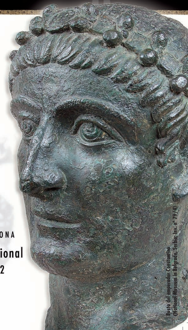
Busto del emperador Constantino (National Museum in Belgrade, Serbia; Inv. n.º 79/4)