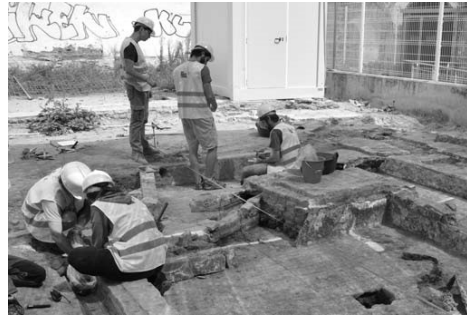
Figura 1 Alumnes del Grau d'Arqueologia de la UB durant el procés de documentació de les estructures localitzades.