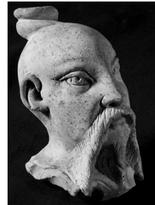
Figura 2 Figura de terrissa del taller d'Antoni Tarrés

El ventall cronològic que s'ha pogut constatar al lloc va des de les primeres estructures del segle XVII, que separaven la finca de la Casa de Misericòrdia de les del carrer dels Tallers, fins a les restes del darrer edifici que va ocupar el lloc, enderrocat l'any 2005, que ja no tenia cap relació amb l'antiga terrisse-