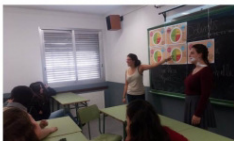
Som el que mengem? / tu què vols ser? Mites i errades de l'alimentació Facultat de Farmàcia i Ciències de l'Alimentació Institut Vila de Gràcia

Aquest projecte és possible gràcies al suport del Vicerectorat de Política Docent i Lingüística de la Universitat de Barcelona com a Projecte d'Innovació Docent (2015PID-UB/150)