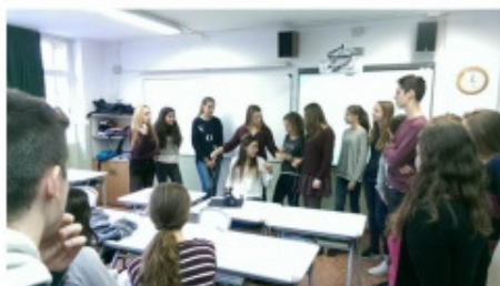
Relacions tòxiques: tallar amb la parella Facultat d'Educació Jesuïtes de Gràcia Col·legi Kostka