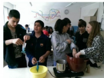
Accionem amb mètodes de creació d'artistes Facultat de Belles Arts Institut Príncep de Girona