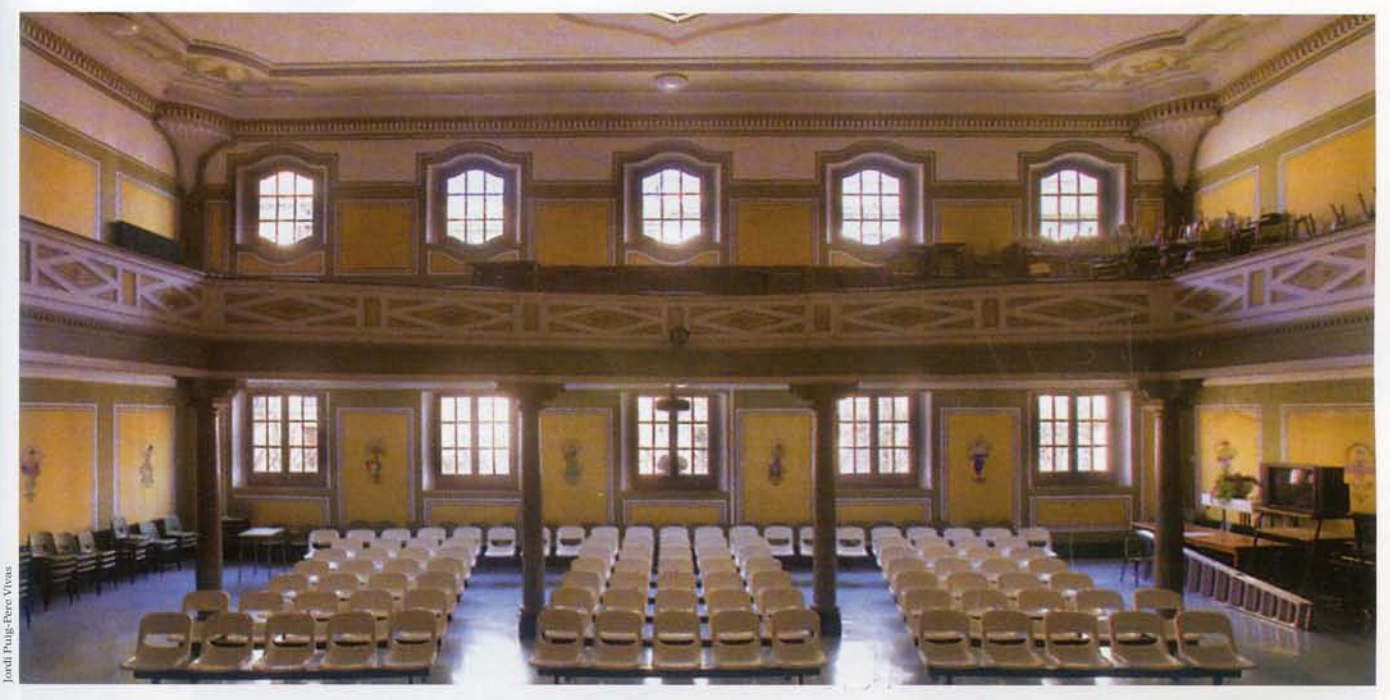
La sala d'actes, vista des de l'escenari, del Grup Escolar Milà i Fontanals

ses i poc estandarditzades, per dedicar excessiu espai a vestíbuls, per compondre les plantes segons eixos de simetria, per l'excessiva alçada, per la preocupació de monumentalitat, per no substituir les teulades per terrats i per la decoració i ornamentació tradicional, entre altres arguments. Paradoxalment, la crítica a Goday li arribà en un moment en què ell començava a experimentar o flirtejar amb el llenguatge arquitectònic de la modernitat. En efecte, l'escola Collaso i Gil (on adopta un repertori formal totalment nou d'influència nòrdica tal com ja fa anys va assenyalar Oriol Bohigas), les Escoles Fabra d'Alella (1933), el pavelló Hèlios de la Maternitat de les Corts (1933), el pavelló de banys de mar per a l'Ajuntament de Barcelona a Castelldefels (1935), o el projecte per a un prototip d'escola que elaborà el 1935 en col·laboració amb el pedagog Artur Martorell, són bons exemples del seu viratge cap a posicions més pròximes a les avantguardes.