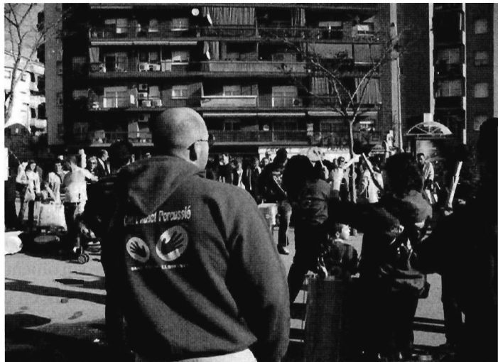
Fundació Mariana. Batucada.

En el marc dels projectes artístics d'intervenció comunitària, ens topem amb una sèrie de termes provinents de contextos diferenciats i que expliciten canvis en la manera de comprendre tant el desenvolupament de la pràctica artística com l'objectiu final que acaba prenent el treball comunitari. En sí, aporten diferents maneres de comprendre el treball i l'acció comunitària. Concretament, en la definició d'aquest seguit de propostes, es produeix una clara diferenciació entre els contextos francòfons i anglòfons que porta a comprendre el treball comunitari des de punts de vista diversos. Concretament parlem de dos conceptes claus: la dinamització sociocultural i el desenvolupament comunitari. Ambdós persegueixen objectius similars basats en l'apoderament de les persones i en la