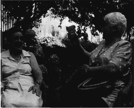
Ubú TV. Taller amb persones grans.

l'emancipació i el desenvolupament d'una comunitat ja sigui aquesta definida pel territori o per una afinitat o interès. El Desenvolupament Cultural Comunitari es planteja com una resposta als efectes homogeneïtzadors de la globalització ja que es proposa ajudar a les persones a pensar críticament sobre les seves experiències. Parteix de comprendre la cultura com a element crucial on es forgen la creativitat i l'autonomia. D'aquesta