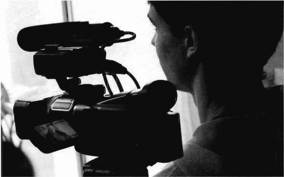
Teleduca. Educació i Comunicació. Projecte: Mirades Mineres.

en la que viuen, desenvolupin un rol actiu i reivindicatiu. El procés d'apoderar comporta un trencament amb certes dinàmiques directives i no reflexives per tal de construir processos horitzontals de treball en col·laboració. Les pràctiques d'apoderament es basen en generar processos de canvi que parteixen de les relacions.