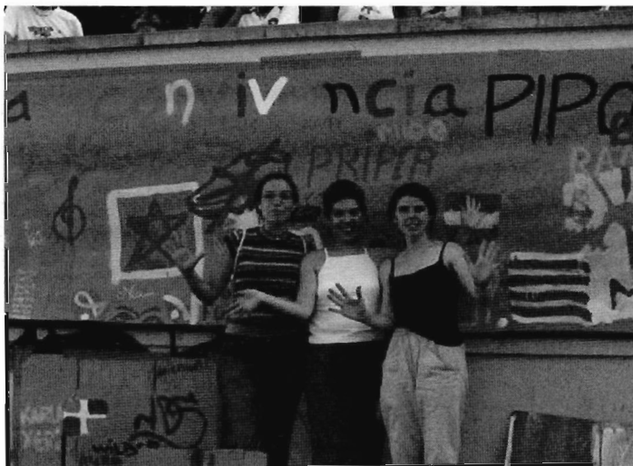
Casal dels Infants del Raval. Projecte: Barri Educador.

La creativitat, tot i tenir un paper cabdal en tot el procés de posada en pràctica no esdevé la finalitat última. És el marc a partir del qual es construeixen processos educatius en els que es barregen diversos components d'igual importància: la participació, la relació i l'interacció, l'empoderament, la visibilitat, el reconeixement i el diàleg, entre d'altres.