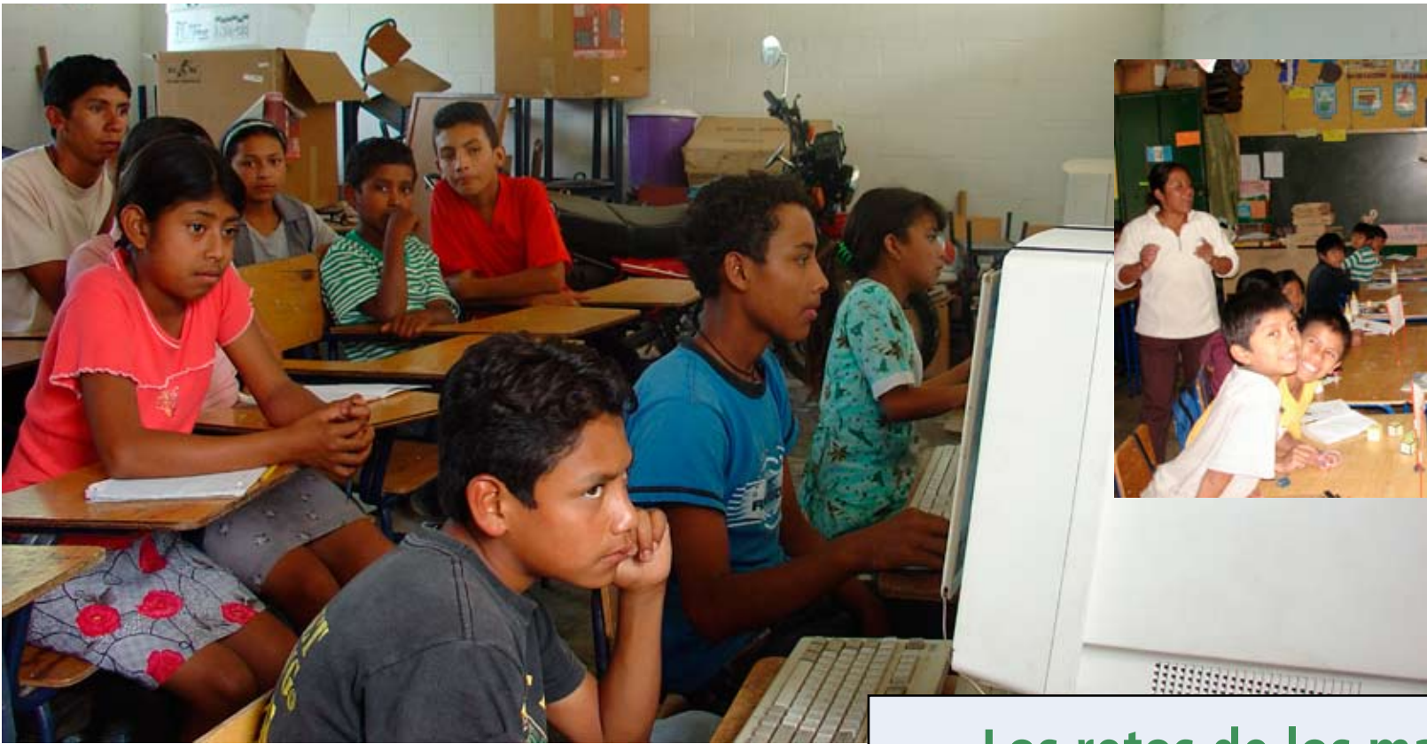
Algunos estudiantes guatemaltecos en clase con sus Maestros 100 puntos .

SONIA MAYESLYN SOTO Centro multicultural de aprendizaje y desarrollo de inteligencias múltiples