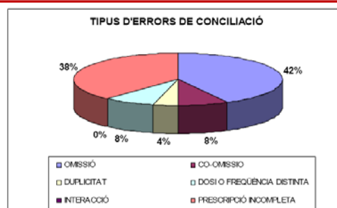
Tipus d'errors de conciliació.