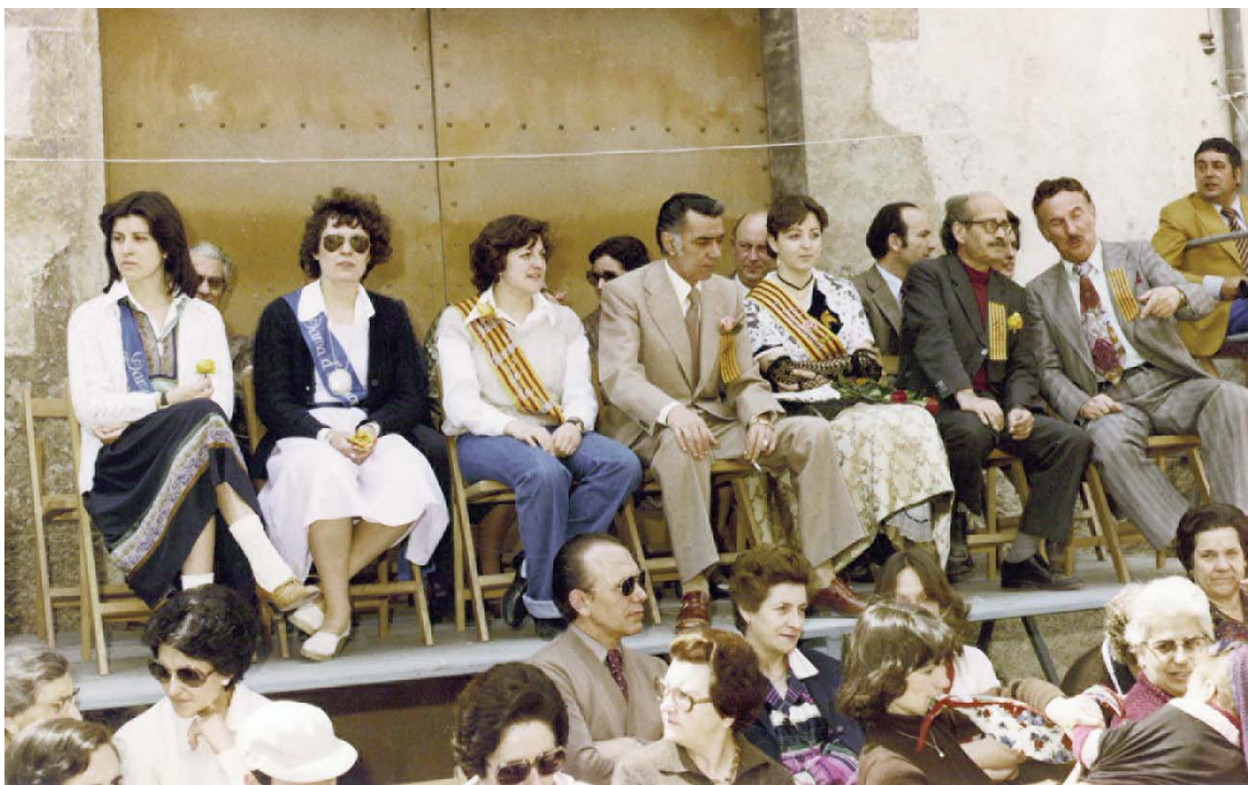
Miquel Tarradell a l'aplec de l'esbart dansaire de Tona, el maig de 1978

En un retrat breu, però magistral, Josep Faulí va deixar escrit que "Tarradell no ha renunciado nunca a su condición de intelectual, pero ésta no ha sido para él una barrera infranqueable ni una torre de marfil segregadora. Tarradell ha ejercido como intelectual a la altura de los tiempos que le ha tocado vivir"..., i afegeix "he tenido ocasión de comprobar su entereza, su generosidad y su altura de miras, siempre más próximo de ayudar que de presumir, mucho más amigo de convencer que de imponer". Jo no el sabria definir millor.