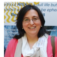
M. Guillén Riskcenter, UB