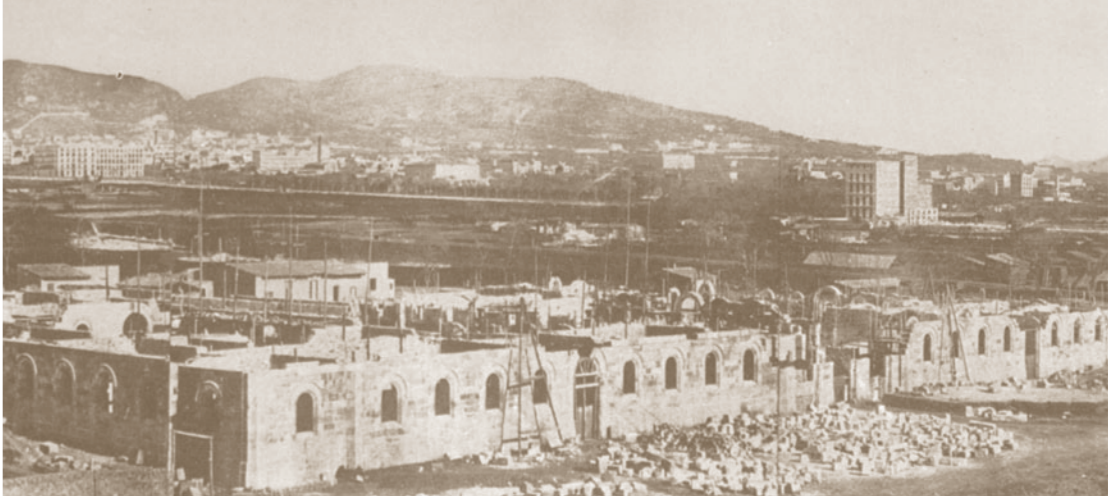
L'Edifici Històric en construcció, l'Eixample sense edificar, i la serra de Collserola al fons