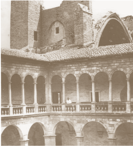
Claustre del convent del Carme, seu de la Universitat restaurada des del curs 1838-1839

Durant els cent vint anys en què Barcelona no va tenir universitat hi va haver institucions, algunes creades de nou i d'altres que ja existien, que es van encarregar d'impartir alta cultura, com el Col·legi de Cordelles dels jesuïtes o el dels dominics del convent de Santa Caterina. Es van crear centres com el Col·legi de Cirurgia; hi havia els ensenyaments de Nàutica, Geografia, Belles Arts, Cartografia, Matemàtiques i Astronomia, patrocinats per la Junta de Comerç, i el 1806 es va instituir el Reial Col·legi de Farmàcia, que funcionava pràcticament com una facultat universitària. Aquestes institucions van fer que els estudis superiors ressorgissin amb força a