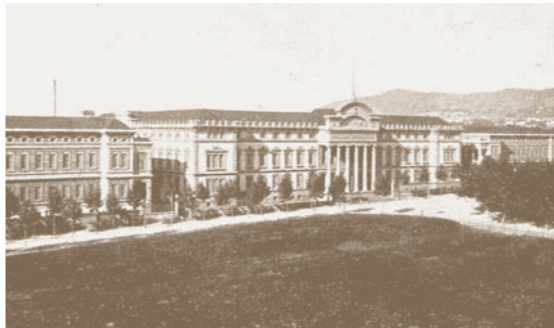
Facultat de Medicina i Hospital Clínic

El període de major llibertat del sexenni democràtic va comportar canvis a les universitats espanyoles, que també es van notar a la de Barcelona. Fins i tot la matrícula d'estudiants va arribar a un dels màxims del segle xix : el 1863 tenia 1.100 estudiants i el 1869 en tenia 2.600. Però tot i els canvis en els estudis a Barcelona, el nomenament de rector es feia des de Madrid, i també el del càrrec de visitador de la Junta Universitària de Compromissaris.