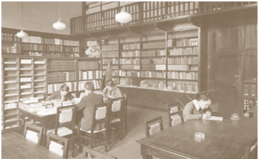
Treball de seminari (1934)