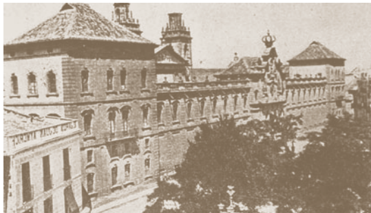
La Universitat de Cervera

La penúria i la decadència de totes les universitats catalanes a principis del segle xviii van permetre als reformistes d'aconsellar a Felip V, després