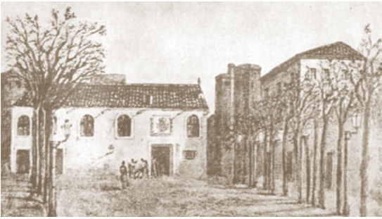
Edifici de l'Estudi General de Barcelona, a la Rambla. El 1718 va ser convertit en quarter

de la victòria borbònica a la Guerra de Successió, que suprimís totes les universitats del Principat de Catalunya. Volien que amb el patrimoni de totes se'n creés una de nova, potent i moderna, d'acord amb les idees del despotisme il·lustrat, la ideologia que prosperava a l'època. Hi va haver un seriós intent de racionalització del sistema educatiu superior a tota l'Europa il·lustrada, i alhora un intent clar d'intervenció del poder polític central en els centres d'ensenyament superior. Després del 1714, doncs, es produeix la unificació de totes les universitats del Principat (Lleida, Barcelona, Girona, Tarragona, Vic, Solsona i Tortosa) i es crea el nou centre a Cervera, al qual s'oposaven les autoritats catalanes. A partir del 1717 la Universitat de Cervera va tenir el monopoli de tot l'ensenyament superior al Principat de Catalunya.