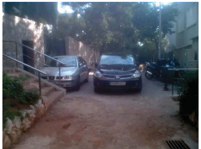
"Al final del carrer de Musitu la presència de vehicles aparcats impedit el pas dels vianants s'ha fet habitual"