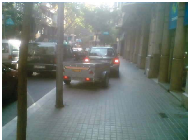
(sense comentaris: estacionament amb remolc sobre la vorera al carrer Craywinckel)