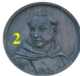
Fray Pedro Ponce de León

Todo lo contrario ocurre con la esfinge de Fray Pedro Ponce de León, del cual se han encontrado dos representaciones, una es un grabado del cual no se identifican las inscripciones que en él figuran y el otro un dibujo a carboncillo, y a partir de los cuales Josep Marqués se inspiró para realizarlo, a la vez que, muy probablemente también fueron utilizados como modelos para la representación escultórica en mármol.