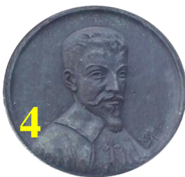
Juan Pablo Bonet