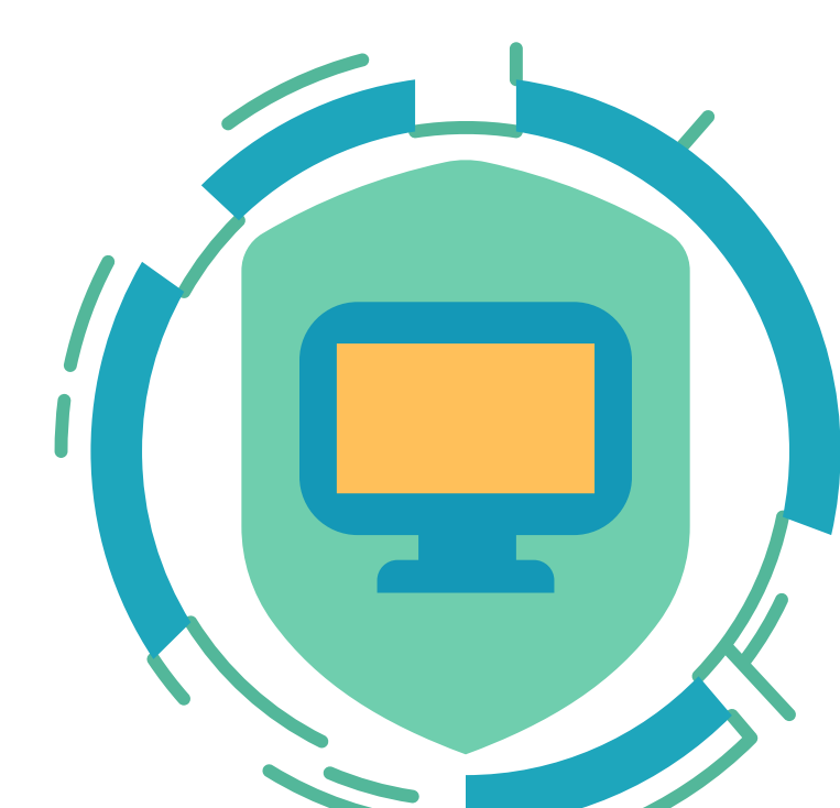
Digitalización y ciberriesgos