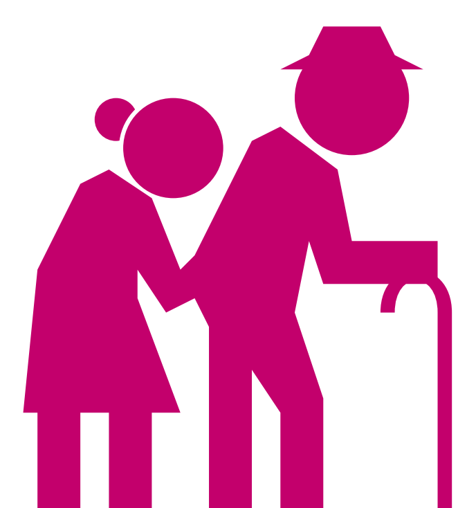
Cambio social y gobernanza