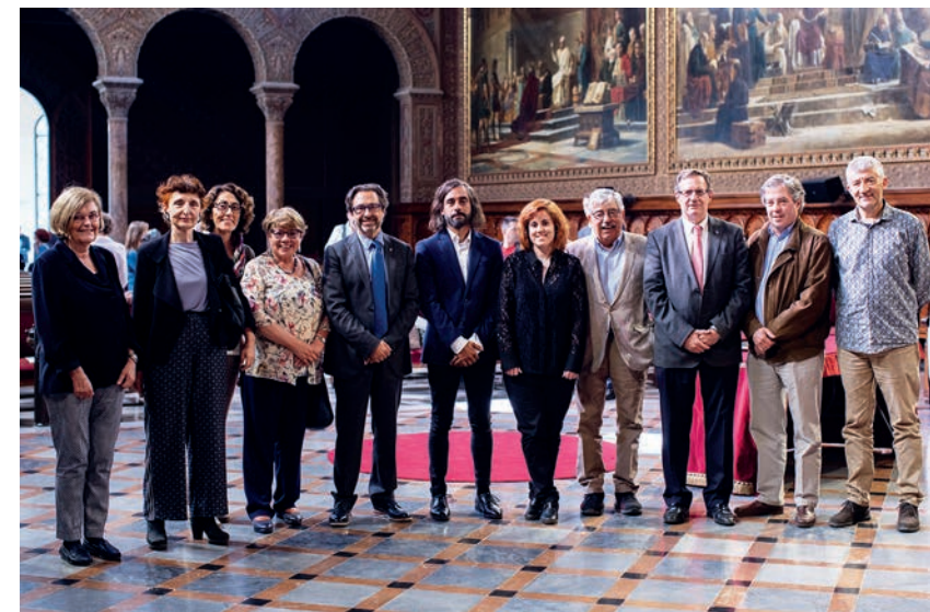
Acte del lliurament dels premis dels anys 2019, 2020 i 2021 (10 de maig de 2022).