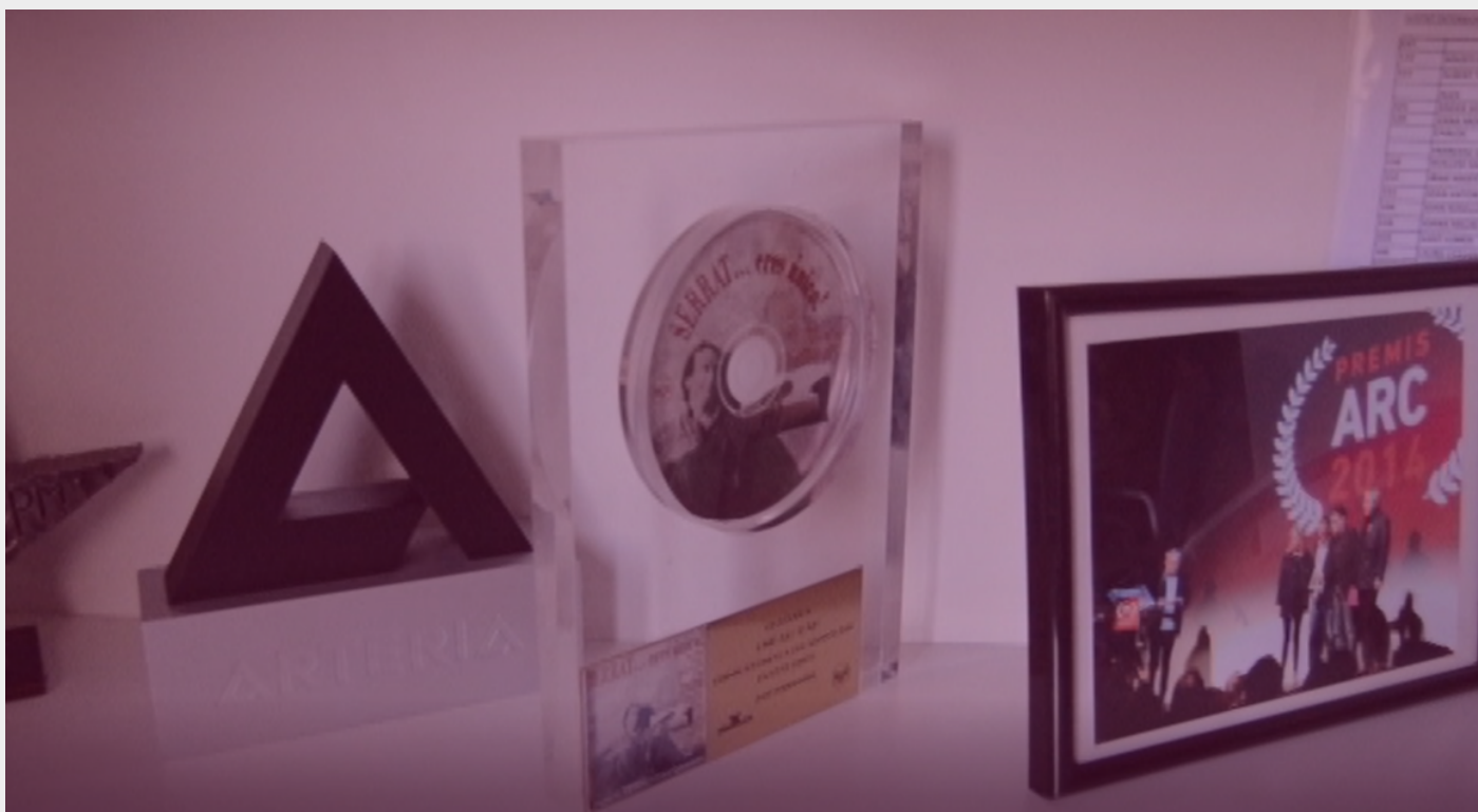
Premios de The Project.

GuitarBCN no es el concepto de festival al que estamos acostumbrados, que dura un fin de semana. Creo que hay más ventajas que inconvenientes en el hecho de trabajar con tanto tiempo vista, ya que te da margen para promocionar los conciertos, dedicarte a la producción el tiempo que haga falta... Creo que espaciar los conciertos en el tiempo es una manera de mimarlos. Para nosotros, cada