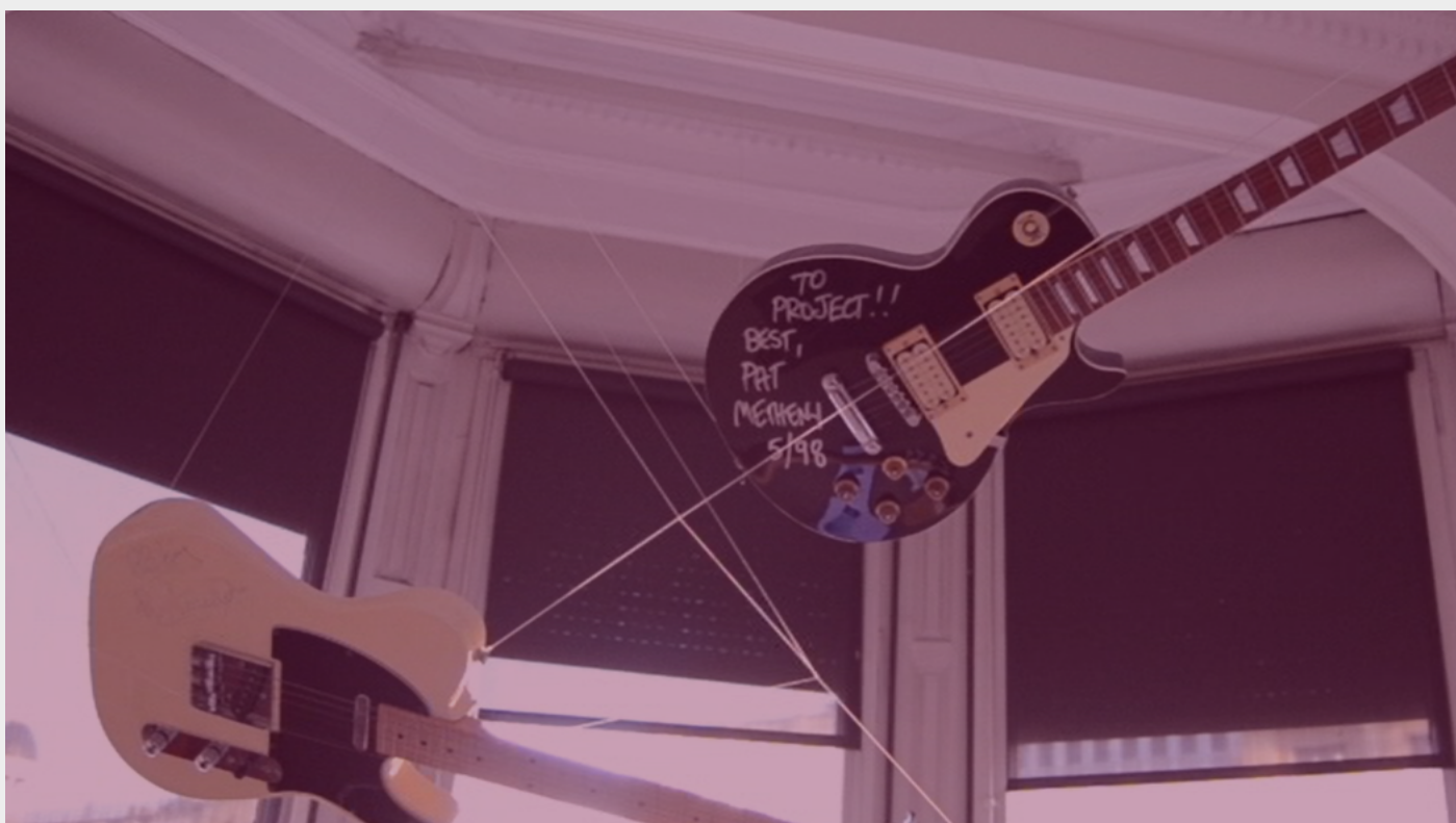
Decoración en The Project.

Yo en mis festivales siempre he programado mujeres, y no es por hacer cuota. No he pensado en hacer cuota jamás en mi vida. Creo que hay mujeres buenísimas. He traba-