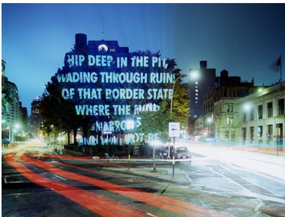
Figura 4. Jenny Holzer. For New York City . 2004. Cooper Union, New York, 2007.

Paral·lelament, a l'espai públic sorgeixen també pràctiques de resistència local, accions i experiències que neixen com a resposta a la urbanitat planificada, i que actuen més enllà de la definició institucionalitzada de l'espai per convertir-lo en lloc d'esdeveniment. Són actuacions que responen també a una subjectivitat nòmada . Es tracta, doncs, d'accions autogestionades i de duració temporal. Aquest seria el cas del que Giovanni La Varra anomena post-it city [18], “dispositiu de funcionament de la ciutat contemporània que concerneix les dinàmiques de la vida col·lectiva fora dels canals convencionals”. Aquest