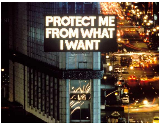
Figura 3. Jenny Holzer. Truisms . 1977–79. Times Square, New York, 1986.

I és aquí on la subjectivitat nòmada incideix, altra vegada, a través de la pràctica creativa, sobre unes coordenades pre-establertes i despersonalitzades, i les dota de significació latent. Seria el cas dels projectes de Jenny Holzer. Amb ella, l'espai públic concebut com a mer trànsit es converteix en un text ple de significació “ marcado por signos y carteles que indican una multitud de direcciones posibles, a las cuales la artista les agrega la suya, inesperada y provocativa. ” [17]