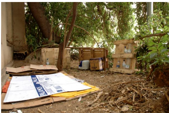
Figura 5. Paraarquitectura d'un indigent. Imatge pertanyent al projecte web idea-lista.org de Roberto García, M. Dolors González i Mireia Feliu. 2008.

1. El negoci immobiliari com a representació del subjecte que té accés a la mobilitat cibernètica (recordem que el projecte era en format web) i que viu integrat en l'anonimat de la ciutat planificada, representada per la pròpia pàgina web, i amb una tendència a la homogeneïtat social, política, cultural i econòmica (reflectida en la interactivitat).