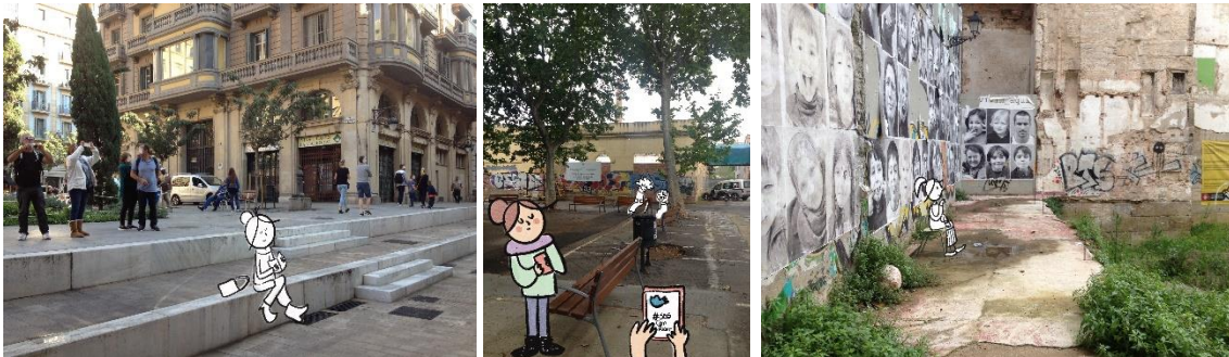
Algunas escenas de lugares patrimoniales transformados o en transformación de la ciudad de Barcelona. De izquierda a derecha, Paseo de las Murallas (Gòtic), Can Ricart (Poblenou) y el Solar de la Muralla, actual Plaza de Carme Simò).

En el proyecto Deep Cities , analizamos el valor de las transformaciones históricas urbanas de forma crítica, preguntándonos si las regeneraciones urbanas guiadas/conducidas por el patrimonio desafían los supuestos inherentes a los valores del patrimonio preestablecidos e influyen en la construcción de la comunidad mejorando aspectos como la cohesión social, el bienestar y la educación, entre otros (su impacto social). Para poder conocer este impacto trabajaremos con sistemas dinámicos, participativos y técnicas vinculadas a las Humanidades Digitales. Es por ello que de forma transversal, buscamos indagar en mejorar las estrategias de evaluación y comprensión del impacto social de nuestros trabajos.