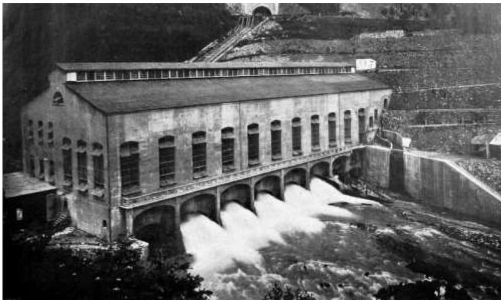
Figura 4. Casa de máquinas de Necaxa.

cada unidad generadora de esta planta superaba por sí sola la capacidad de cualquier otra instalación hidroeléctrica existente en el país, y de acuerdo a registros de Voith, los generadores ordenados en 1903 para la planta de Necaxa contaban con la mayor capacidad del mundo con 6.25 MVA 57 .