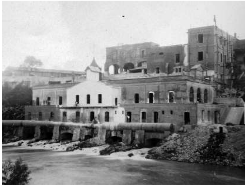
Figura 3. Planta El Salto vista desde Juanacatlán.

consecuencia de una continua reorganización social a partir de la integración de nuevos accionistas y la adquisición de otras compañías, hasta que el 13 de julio de 1909 formó parte de los bienes con los que se constituyó la Compañía Hidroeléctrica e Irrigadora del Chapala, Sociedad Anónima 35 .