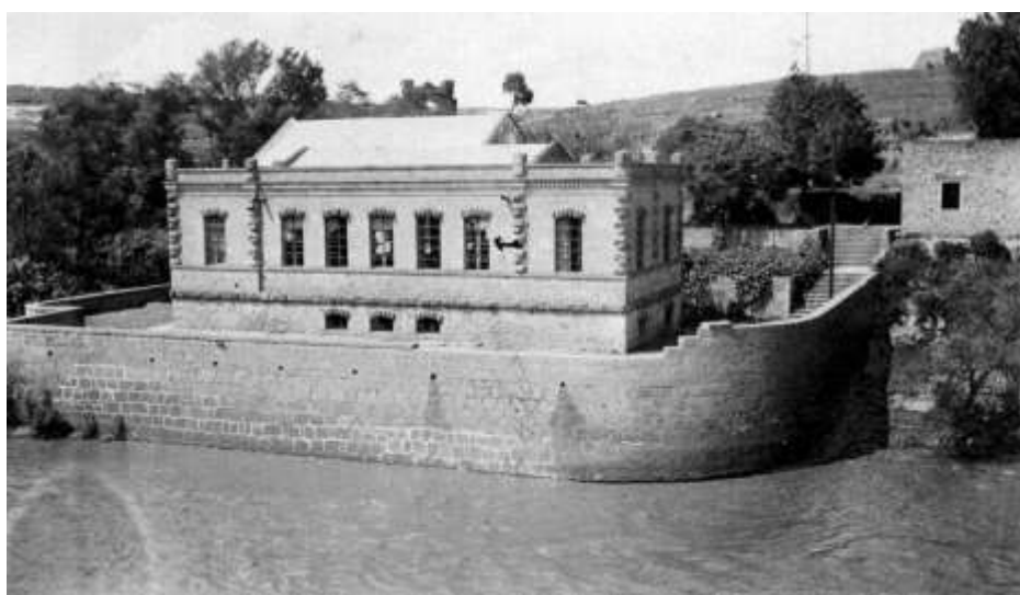
Figura 1. Planta de Echeverría en la década de 1920.

Al finalizar el siglo XIX, la Compañía Anónima del Alumbrado Eléctrico de Puebla había aumentado notoriamente su capacidad de generación de energía eléctrica, ya que además de la instalación de nuevo equipo en Echeverría, pocos años después de su puesta en marcha la compañía construyó una subestación eléctrica en la calle de Nopalito que contó con una planta de vapor y que más tarde aumentó también su capacidad, de modo que para el año de 1900 las dos unidades alimentaban 224 lámparas de arco de 1.200 bujías y 2.500 lámparas de incandescencia de 16 a 32 bujías 21 . Sin embargo, a pesar del provecho que la planta hidroeléctrica había representado hasta entonces para la compañía, las mismas condiciones que le permitieron aprovechar los derechos de uso de aguas que disponía Sebastián B. de Mier en el Atoyac, serían las mismas que pronto ocasionarían el cierre de esta unidad.