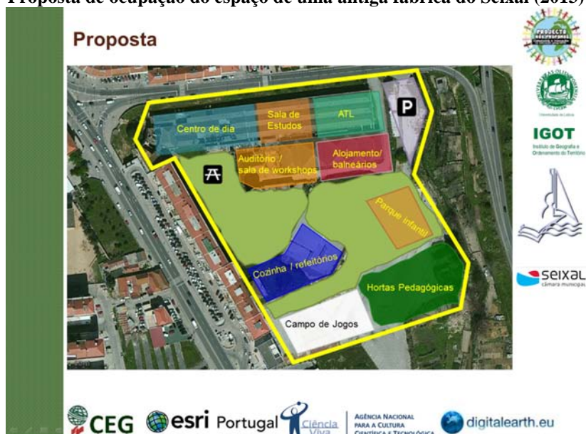
Figura 2. Proposta de ocupação do espaço de uma antiga fábrica do Seixal (2013)