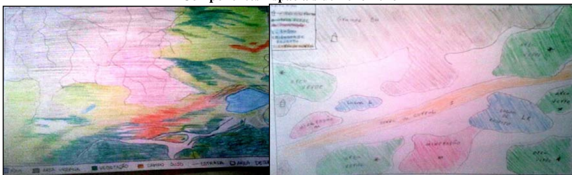
Figura 1. Componentes Espaciais de Fenômeno

Em seguida, pediu-se aos professores que produzissem um croqui expondo as relações interativas entre os componentes identificados na etapa anterior. Não era necessário seguir regras cartográficas baseadas na semiologia. O croqui deveria ser a compreensão dos docentes frente às relações estabelecidas entre os componentes a fim de se produzir o fenômeno em foco. Nessa etapa as produções dos professores indicaram o forte vínculo com o olhar unitário, que contempla os componentes em separado, sem conseguir indicar as interações entre eles e a consequência dessas na organização espacial. Os componentes espaciais decorrentes de interações entre um ou mais constituintes espaciais, tais como movimentos de massa e desmoronamentos de habitações, não apareceram em nenhuma representação (Figura 2).