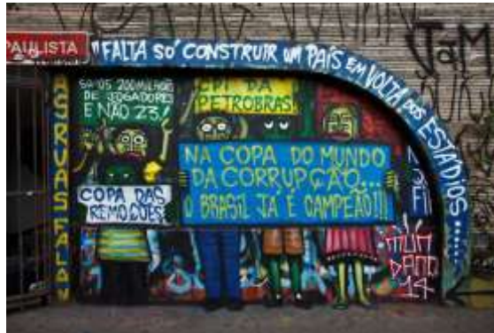
Figura 4. Grafite de Thiago Mundano refeito na Rua da Consolação, São Paulo, Brasil.