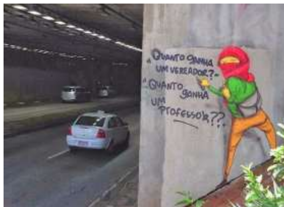
Figura 5: Grafite dos Gêmeos: arte como crítica, em São Paulo, Brasil.