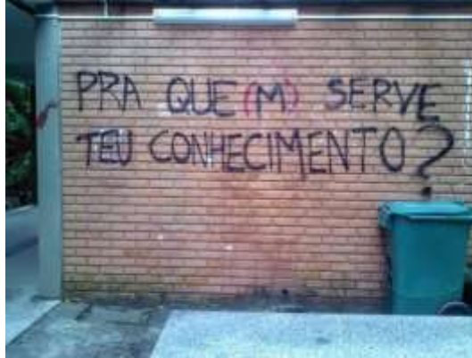
Figura 3. Luta pela desalienação II