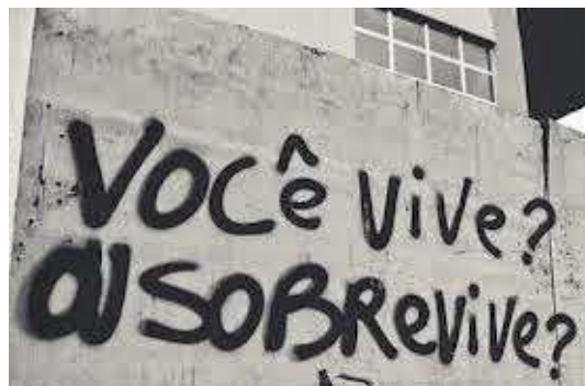
Figura 2. O mesmo texto foi pixado em maio de 1968 em Paris