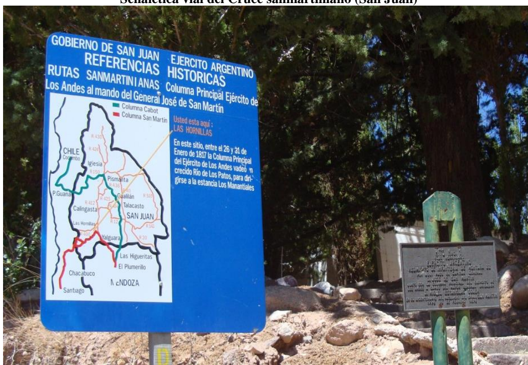
Recorridos históricos sobre mapas con la división jurídica del presente.

En síntesis, el proceso de recreación del Cruce de los Andes de San Martín por parte del Gobierno de San Juan busca tres objetivos: en primer lugar, legitimar el proceso de “integración con Chile” a partir de mostrar la continuidad histórica entre el cruce cordillerano (renovando en los abrazos de las comitivas, la hermandad) y las dinámicas políticas actuales, en segundo lugar, otorgarle a San Juan un protagonismo en la “gesta” al ratificar que San Martín cruzó por la “cordillera sanjuanina” para liberar a los chilenos, y en tercer lugar promocionar la recreación del cruce cordillerano como un atractivo turístico 20 .