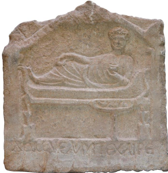
Fig. 1. Imagen de la nueva estela romana.

El nombre Δόμνε se encuentra en vocativo. Y Δόμνος / Domnos (i.e., Domnus , síncopa del nombre latino Dominus ), aparece documentado en la ciudad de Antioquía del Orontes (Siria), 2 aunque escasamente si se compara con el listado existente en otros territorios, recogidos en el Lexicon of Greek Personal Names . 3 En cuanto a ἄλυπε χαῖρε, se trata de una típica fórmula de despedida que puede traducirse como ‘libre de preocupaciones y sufrimientos, sin dolor, sin penas’ o similar, bien atestiguada en epitafios griegos de la Gran Siria y en otras partes orientales. 4